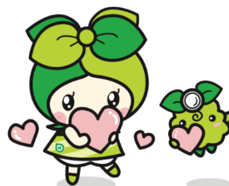
かつらちゃんとゲノム博士