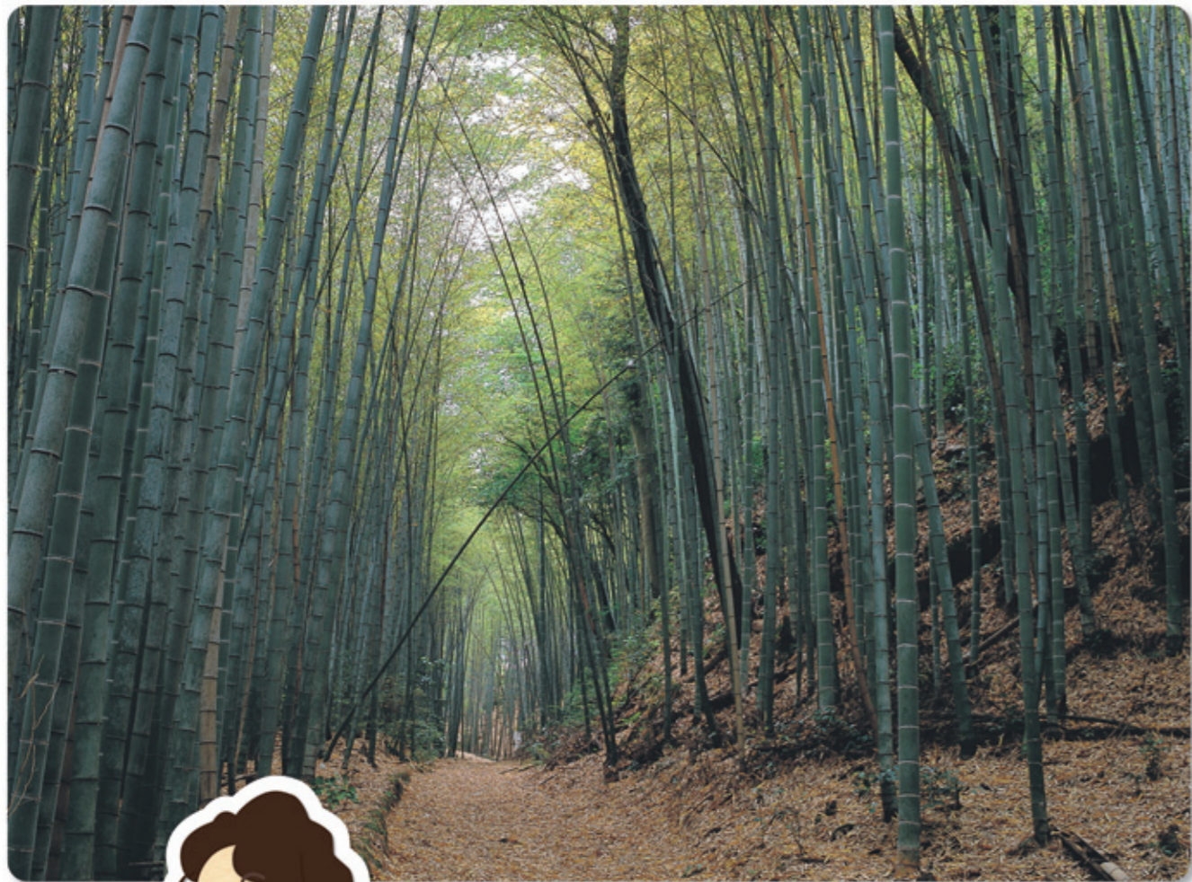
松尾 東海自然歩道

編集：広報委員会・広報課 印刷：有限会社 アクト 〒615-8256 京都市西京区山田平尾町17 TEL.075-391-5811(代)