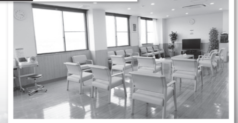
写真2 中待合からの眺め

新しくなった健康管理中心は、外来患者と動線の異なる専用の駐車場・入口からエレベーターで5階に上がって受付いただきます。新しく、明るくなった中待合(写真1)からの見晴らしは素晴らしく、待ち時間を少しでもくつろいで過ごしていただければと思っております(写真2)。 人間ドックのドックは、船を修理・点検するための設備である船渠(センキョ)を意味する英語:dockに由来し、我国では当初「短期入院精密身体検査」と堅苦しく称されていた検査が、1950年代に人間ドックという呼び名で定着した様です。社員に労働安全衛生法に基づき義務化されている法定健診や自治体が主催する市民健診などは検査内容が限られております。船舶がドックで総点検する様に、よりきめ細かい検査が可能な人間ドックを受けていただくことで、予防医学的には、病気の発症を予防して健康増進を図るために