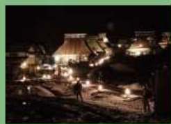
美山診療所がある美しい美山町の風景